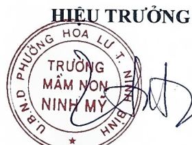
Nguyễn Thị Bình